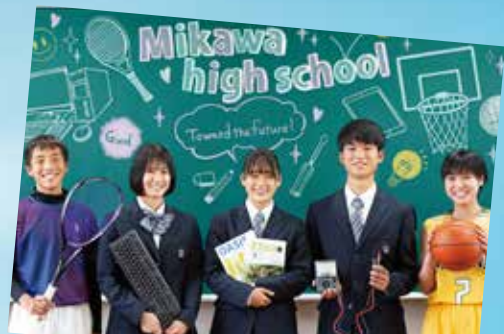
愛知産業大学三河高等学校