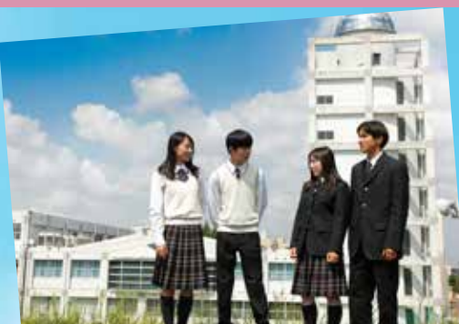
岡崎城西高等学校