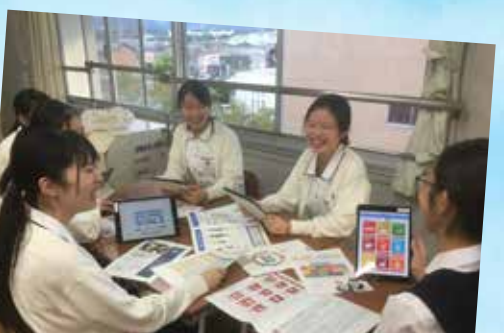
光ヶ丘女子高等学校