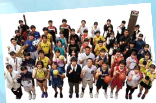
安城学園高等学校