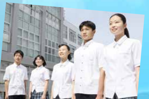
岡崎学園高等学校